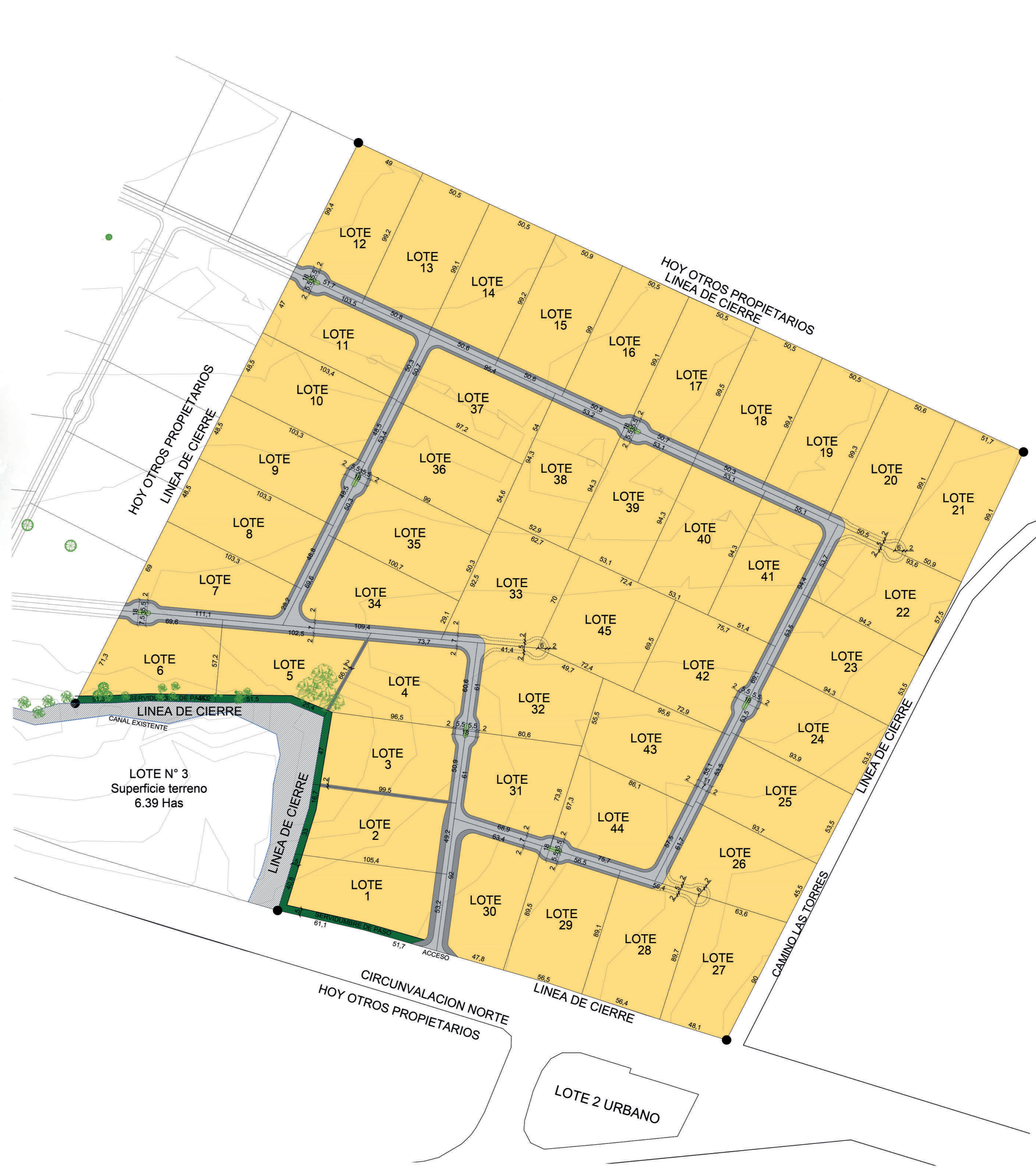
CUADRO DE SUPERFICIES SITUACION PROPUESTA